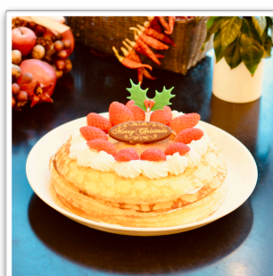
米粉ミルクレープ 【グルテンフリー】 18cm ¥3,200