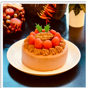
チョコ生デコ 12cm ¥4,000 15cm ¥5,200 18cm ¥6,400