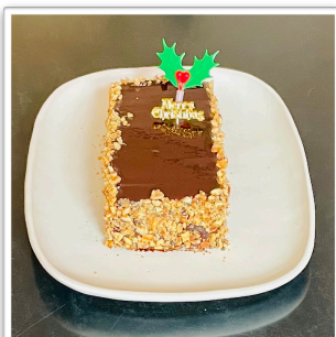
チョコレートケーキ 【グルテンフリー】 8X15cm 4~6人分 ¥4,200