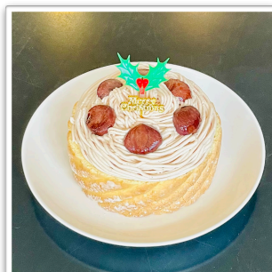
栗のパバロア 15cm ¥3,000