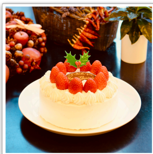
イチゴ生デコ 12cm ¥3,900 15cm ¥5,100 18cm ¥6,300

ご予約は12/13(土)まで店頭にて。総数70台で予約終了につきお早めに！ お受け取り日は、12/22~27からお選びください。