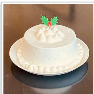
米粉シフォン・プレーン 【グルテンフリー】 17cm ¥2,400