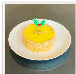
レモンとチーズのパバロア 12cm ¥2,400