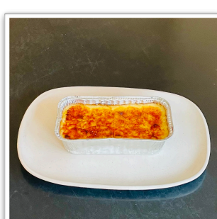
冷凍カタラーナ 4~6人分 ¥2,200